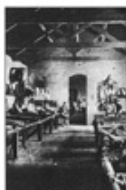
Ֆրանսիական Գվյանայի քարտեզ