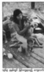
Ֆրանսիական Գվյանայի քարտեզ (1890 թվական)