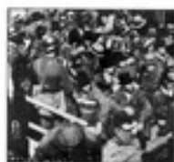
Ֆրանսիական Գվյանայի քարտեզ