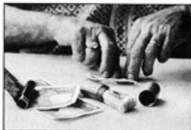
ခရီးတွင် ဂုဏ်ရှိသလှသည့် ဓနုစက္ကူများ