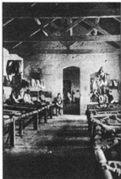
တက္ကသိုလ် မိလီတူးဖန်ဆင်းသည့် အကျဉ်းခန်း