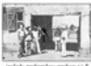
Ֆրանսիական Գվյանայի քարտեզ (1890 թվական)