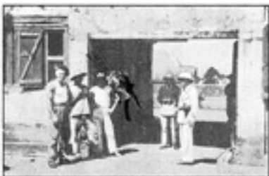
(လွယ်ရယ်) အကွင်းဆောင်ဓမ္မ အကွင်းသား (၃) ဦး