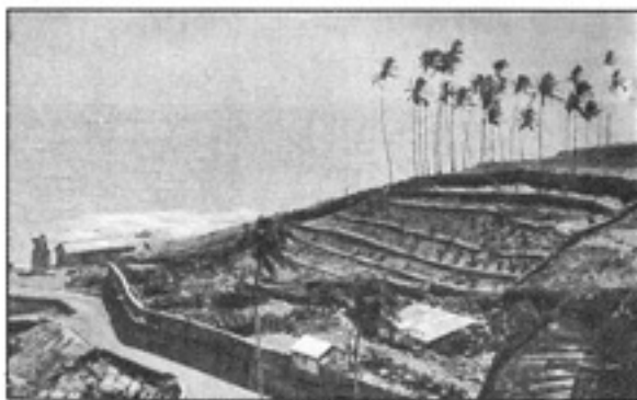
(လွယ်ရမ်း) အကွင်းခေါ်နေ မိတ်လွန်လွက်ခြေရာ၌ အသုံးပြုမည့်စားကို ဝက်ထားခဲ့သော ဟင်သီဟင်ဒူးရွက်ဥယျာဉ်