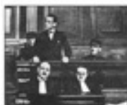
Ֆրանսիական Գվյանայի քարտեզ (1890 թվական)