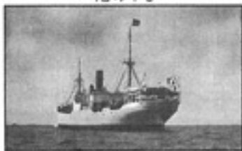
(ဂီရာနာ) သို့ မိလီတူးကိုပို့ခဲ့သည့် သင်္ဘော