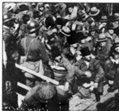
သင်္ဘောကုန်းပတ်ပေါ် အကောင်အမန်းများ