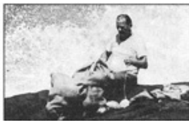
၁၉၃၉ ခုနှစ်တွင် ထွက်ပြေးရာ၌ မောင်အခြေခံသုံးခဲ့သည့် ဖုန်းသီးစိတ်များကို ပီပီလွန် လက်တွေ့အစမ်းပြနေရာ