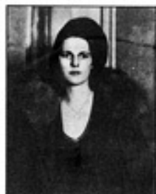
မိလိလွန်ကို မိန့်တိုင်တိုင်ဆေးစေလိုက် တရားရုံး၌ ငြိမ်စေတဲ့ဥပဒေသာ နီနက်တီး (Nénette)