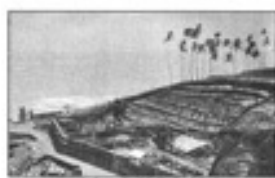
Ֆրանսիական Գվյանայի քարտեզ (1890 թվական)