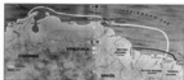
Ֆրանսիական Գվյանայի քարտեզը 1890 թվականի հունիսի 1-ին