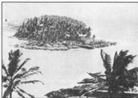
(လွယ်ရယ်) ကွန်ပျ မြင်တွေ့နေရာသည် သစ်ကွန်ပျ-အကွင်းစခန်းမှ အဆောက်အဦများ