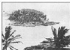
Ֆրանսիական Գվյանայի քարտեզ