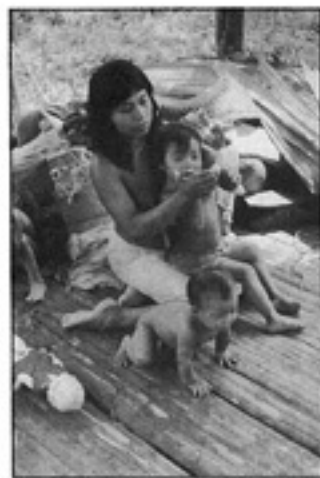
ဝဠင်္ဂ ဗုဒ္ဓတော် မြှင်တွေ့ရာသည့် ကရုဏာလက်ဓမ္မ ကိုလံဘီယာနိုင်ငံသူ