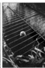
Ֆրանսիական Գվյանայի քարտեզ (1890 թվական)