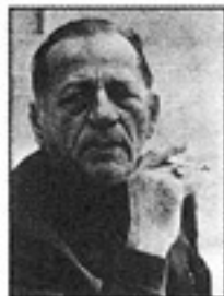
ပီပီလွန်