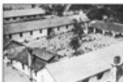
Ֆրանսիական Գվյանայի քարտեզ