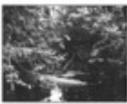
Ֆրանսիական Գվյանայի քարտեզ