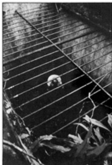
ဝဠင်္ဂ ဗုဒ္ဓတော် မြေအောက်အကျဉ်းခန်းအတွင်း၌ မိလီတူး တက်တွေ့စဉ်ထိုင်ပြီး သမုဒ်ပြုနေပုံ