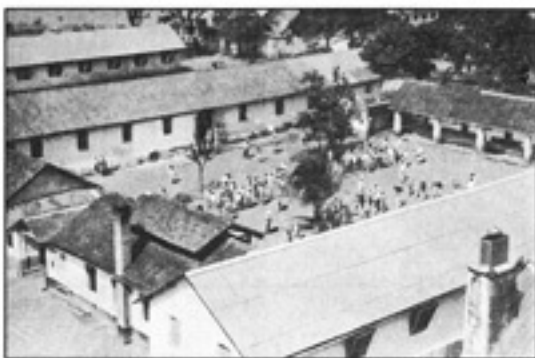
(လွယ်ရမ်း) ကွမ်း အကွင်းခေါ်နေ မုသက်ဘွတ် အကွင်းသာယာအား လွယ်ခေမေးစဉ်