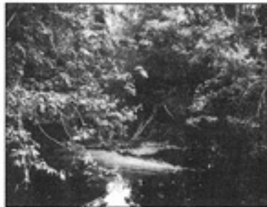
နောက်ဆုံးအခြေချထွက်ခြင်း (ကိုလု)၌ ပီပီလွန်နှင့်အောင်ဆန်းသည်နေရာ