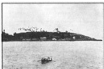
အကျဉ်းသားအချို့အား (လွယ်ရမ်း)အတောင်သို့ လှေဖြင့်ပို့နေစဉ်