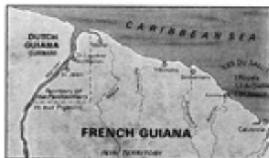
(၁၇၄၄) ခု နှို ငြိမ်သက်အကောင်အမန်းတည်နေရာ